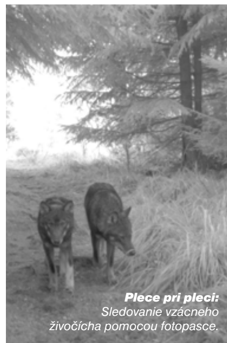
Plece pri pleci: Sledovanie vzácneho živočicha pomocou fotopasce.

Sme krajina s bohatou poľovníckou tradíciou, mnoho poľovníkov chce vlka loviť, a preto dodržiava disciplínu a zásady s tým spojené. Iba niektorým sa pošastilo ho uloviť. Ďalší mali šťastie aspoň ho zahliadnuť, ale väčšina sa s ním ani nestretla. Pri zostavovaní akčného plánu bude pomoc poľovníkov pri monitorovaní a sledovaní tohto vzácneho živočicha najdôležitejším vkladom. Je v našom záujme vytvoriť systém, ktorý pružne a dôveryhodne vyhodnotí, či v love vlka treba pridať, alebo z neho ubrať. ■